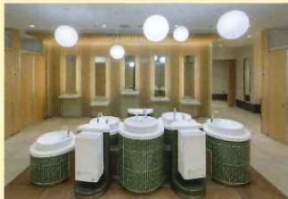
昨年竣工した「雪」は、成田空港第一旅客ターミナル3階出発コンコース（制限エリア）にあります