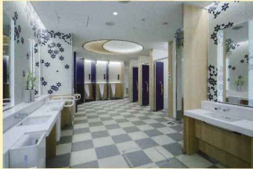
今回竣工した「花」は、1階到着ロビー（一般エリア）にあります。男子トイレは青、女子トイレは赤を基調とし、日本の美を表現しました