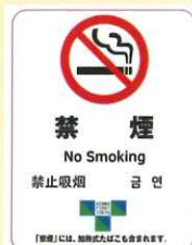
屋内すべてを禁煙とした施設の標識