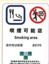
喫煙可能店の標識