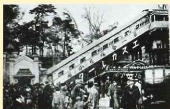
日本初のエスカレーターは1914年に上野の山と不忍池を結ぶ通路に設置