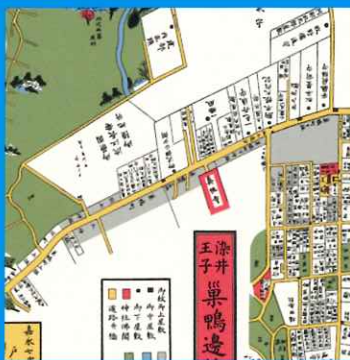
江戸時代末期、1854年の巣鴨周辺の地図