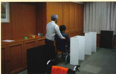
車椅子を使つてのセミナーの様子

る人も多くなっていきます。見た目では健常者と変わらないけれど、何らかの障害を抱えている人も多く、全て含めると人口の10%程度が障害者というデータもあるということでした（これは多い！10人に1人）。