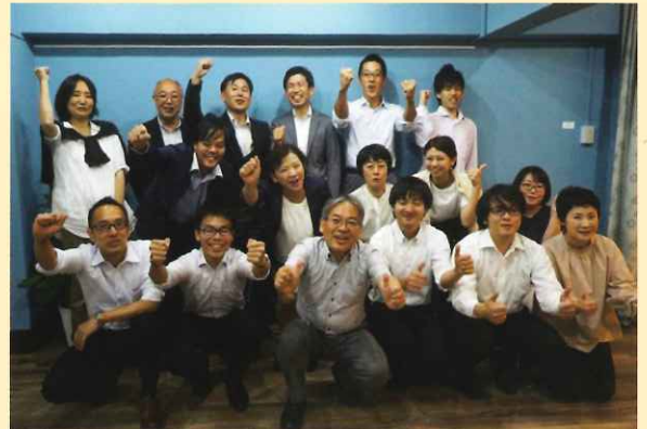
年に一度の合同研修は、社内コミュニケーションの良い機会です

今回の研修で学んだコミュニケーション術を生かし、東西一丸となり社員・パートスタッフ、お仕事を頂ける皆様が互いにハッ