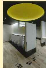
「月」は、4階出発コンコース（制限エリア）にあります。こちらも昨年竣工いたしました