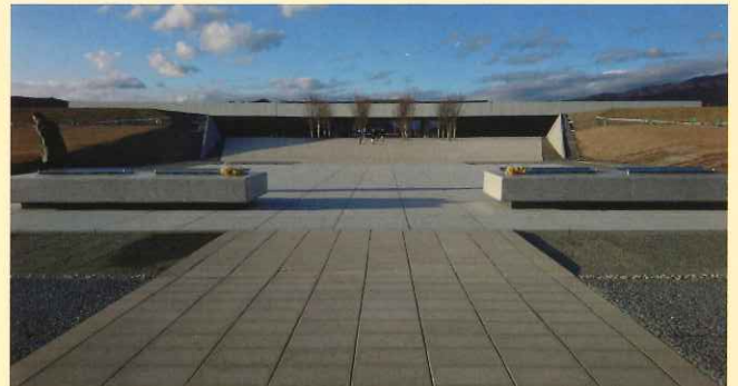
左は、陸前高田の復興のシンボルとして被災者たちの心の支えとなっていた「奇跡の一本松」。上の写真は、内藤廣建築設計事務所設計による陸前高田市の東日本大震災津波伝承館です

うです。他にも津波災害のシンボルとして残す建物が現存しており、甚大な被害の様子をリアルに伝えていました。