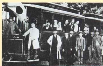
1890年第3回内国勧業博覧会で日本初の電車が上野公園で運転されました