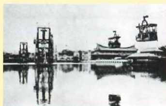
日本初の遊覧ケーブルカーも不忍池の上を横断して設けられました