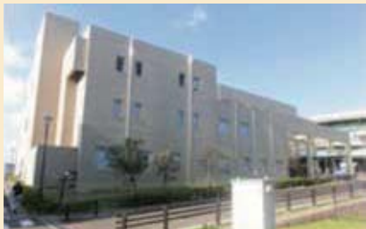
庭窪浄水場の管理本館。調査の結果、緊急的な修繕を必要とする大きな劣化はありませんでした。

劣化度状況調査では各出典に基づいて判定基準を設定のうえ、外壁・屋上防水など建物の状況確認を行いました。タ