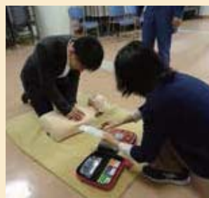
いざという時動けるように真剣に取り組みました

1時間半の講習の後、3班に分かれて胸骨圧迫とAEDを体験しました。私の班では様々なシチュエーションが設定され、その状況下ではどのように処置すればいいかということ学びました。適切な対処というのが座学で聞くより難しくあり、大変勉強になりました。