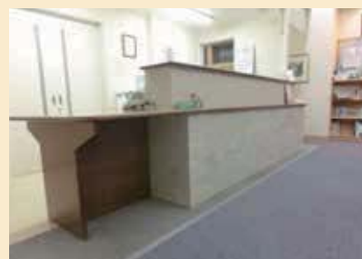
使いやすいと好評のカウンター