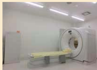
2階に放射線診察部門を集約