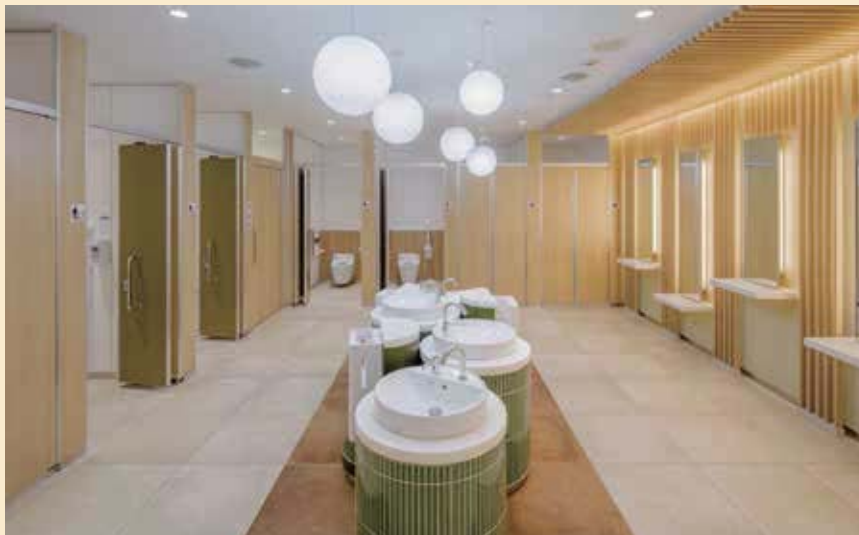
テーマ「雪」第 1 旅客ターミナルビル 3 階

すように。次の竣工も楽しみにしています。成田空港へお越しの際はぜひ「雪月花」のトイレをご利用ください。