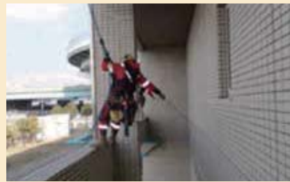
屋上よりロープで降下しながらのタイル外壁調査中

本業務の主目的である『建築物台帳』の作成に関しては、「今後、浄水場施設の維持管理をしていくうえで非常に役立つ