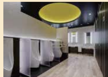
テーマ「月」第 1 旅客ターミナルビル 4 階