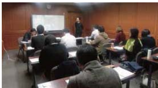
大阪会場でのセミナーの様子