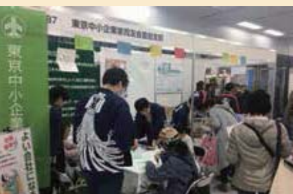
豊島区内の産業見本市として池袋サンシャインシティで行われました

私たちが出展した3月2日は土曜日のため、多くの人に立体カード作りを体験していただきました。「うさぎ」、「飛行機と雲」、「教会」、「おだいきさま」、「おひめさま」の5種類の型紙を20枚ずつ用意しました。「うさぎ」が一番人気で、お昼過ぎには用意した20枚が無くなるほどでした。立体カード作りに参加した子どもたちは、型紙を切って折るだけで立体になるカードが作れたことに喜び、笑顔で一緒に来場していたお父さんやお母さんに見せていました。作ることの楽しさを少しでも感じてもらうことができました。