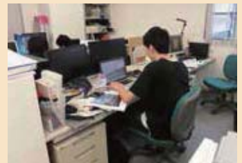
大阪でのインターンシップの様子

大阪本社では今年も 8 月と 9 月の 2 回にわたり、大学インターンシップ生の受け入れを行いました。短い期間の中で設計の仕事により一層興味を持ってもらえる機会となるよう、受け入れる私達も日々自己研鑽が必要だと感じました。