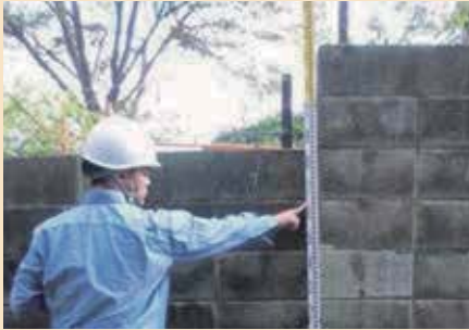
災害に強い街づくりのためには、安全対策の点検が欠かせません

昨年発生した大阪北部を震源とする地震被害を受け、各地でブロック塀の安全性について議論が行われ、耐震診断に係る補助金等も設けられはじめています。