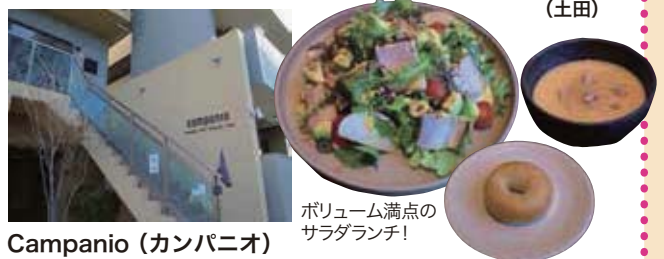
ボリューム満点のサラダランチ！