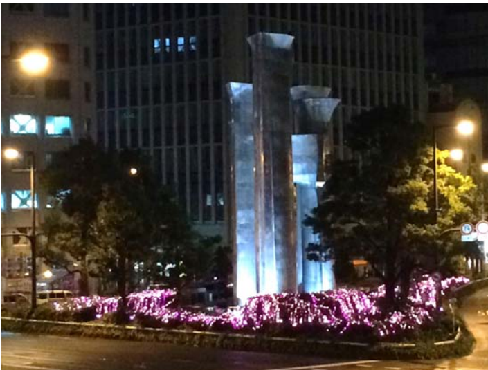
梅田換気塔 点灯確認

大阪のメインストリートである御堂筋で行われる冬のイベント『御堂筋イルミネーション』に、昨年に引き続き今年も設計・監理業務に携わることができました。今年は四季をテーマにしたエリアごとの配色で梅田から難波までの御堂筋沿道を彩ります。